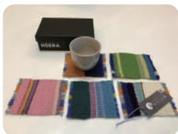
手織りコースター オリジナル布製品