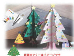
オリジナル ミニツリー(木工)