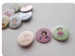
オリジナルイラスト で缶バッジ