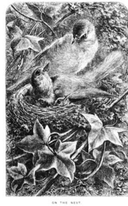
図9 Giacomelliの描くこまどり (1875)

*Mrs. Trimmer. The Story of the Robins Designed to Teach Children the Proper Treatment of Animals. With Illustrations Printed in Colours by Edmond Evans from Original Designs. (The Lansdowne Gift Books) London: Frederick Warne and Co. 1870. 160. 18.3×13.6