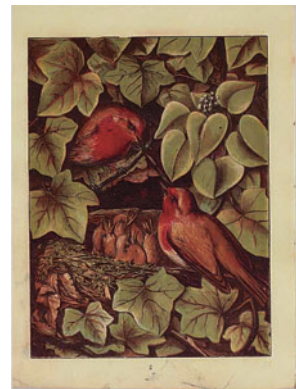
図15 Frederick & Warne社の絵本 The Robins – a Family History より