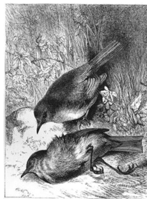
図7 Weirの描くこまどり (1869)

20.8×15.5cmと大型のハードカバーで、表紙には金の型押しが用いられた、豪華な造りの版である。事件の省略・教訓性の強化の行われたテキストが用いられているが、挿絵ではこまどりの物語という点が前面に押し出されている。画家は動物の挿絵画家として著名なHarrison William Weir (1824-1906)で、26点の挿絵が入っている（口絵、表題紙、本文中に24点。なお表題紙にもWeirの名が記されている）。26点のうち、こまどりの登場するもの15点、こまどりは登場しないが、それ以外の鳥（ひばりなど）が描かれたもの7点、鳥の登場しないものは6点（人間のみ1点、人間と鳥の巣1点、人間と動物1点、動物のみ2点）である。全て細かい線で丁寧に書き込まれているが、特に鳥を中心に描いたものは、動きが生き生きと表現されており、鳥ならではのしぐさの愛らしさと同時に、その場面での鳥の感情が伝わってくるような絵である〔図7〕。Weirの絵は後の版でも広く用いられ、本作品の代表的な挿絵となっている。