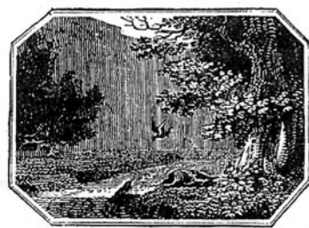
図4 第8版 鳥の挿絵の例

合わせて18点が入っている。人間の視点で描かれたものが13点（うち鳥の姿を認めることのできるものが4点）、鳥の視点で描かれたものは5点（うち鳥だけを描いたものは3点）であった。表題紙に鳥の絵を配することで、鳥の物語ということを前面に打ち出していたものの、総じて人間側に重点を置いて視覚化されていたといえる。