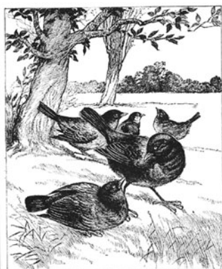
図13 SPCK版より。図11の構図を参考にしたと思われる。

この版の挿絵は、先行の挿絵の構図を採用したものが多いことが特徴である。口絵を入れて31点のうち、Giacomelli のものの構図を用いたのが（左右逆のものも含めて）17点、Weirのものの構図を用いたのが（同）4点ある〔図13〕。元のものと比較すると、線も荒く、鳥の表情も乏しく、挿絵としての魅力には欠ける。し