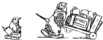
図14 Wells Gardner, Darton & Co.版の服を着たこまどり