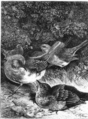
THE GREEDY YOUNG ROBIN—HARRISON WEIR.

“The Story Book Readers for Six Year Old Scholars”の1冊として出版されたもので、再話・要約版としては1793年のものを除くと早い時期のものである。内容面では、いくつかの出来事を重点的に取り上げ、他を大幅に省略していることが特徴である。挿絵はWeirのものを、口絵を含めて8点（うちカラー4点）用いているが、全て鳥を中心としたものである。本来とは異なる場面で、異なるタイトルで用いられている場合があるのが面白い。例えば〔図11〕は、元は見つけた