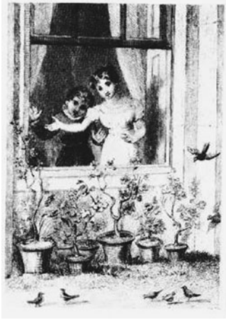
図5 Dove版 口絵 ( Masterworks of Children's Literature 所収)