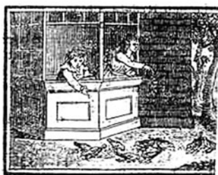
図3 同 挿絵の例

鳥をなるべく画面に入れようとしていること、こまどりの巣の様子や子どもがこまどりに餌をやる場面〔図3〕、子どもが巣をのぞく場面など、後の挿絵でも描かれている場面がすでに採用されていることが注目される。本文73ページ分の中に10点の絵が入っているため、挿絵がふんだんに使われているという印象があり、絵でもある程度ストーリーを追える版になっている。