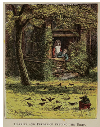
図10 Frederick Warne and Co.版より

19世紀後半にはカラー印刷の技術が発展し、絵本や児童書にも頻繁にもちいられるようになった。この版では表題紙に “with Illustrations Printed in Colours by Edmund Evans” とうたわれており、カラーの挿絵が売り物の一つになっていた。Conclusionを除く各章の冒頭に1ページ大の挿絵が入っている。計16点のうち、鳥を中心に描いたものは1点のみで、人間を中心にしたものが15点(うち鳥を含むもの7点)である〔図10〕。鳥の挿絵を前面に出したものが多くなる中で、人間中