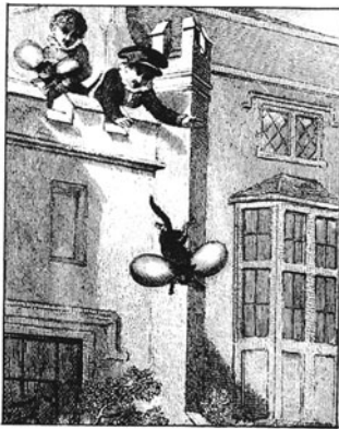
図6 Dove版 猫に豚の膀胱をつけて 落とすいたずらっ子 (同上)