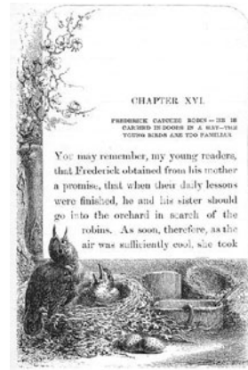
図8 T.Nelson and Sons版 第16章冒頭部

こちら表紙には金の型押しが用いられた、豪華な装丁の版である。本文も旧来の③の系列のものが用いられている。挿絵は表題紙で ‘Illustrator of “the bird”’ と紹介されているHector Giacomelli (1822-1904) のものが約70点入っている。大半が鳥を描いたもので、人間は、こまどりの巣を覗く庭師、少年、少女の各1点と、 The Babes in the Wood 9 を描いたものの1点の4点のみである。(他に植物のみを描いた装飾的な絵や農場風景など、鳥の姿のないものが14点ある。) 章の冒頭部での枠取りや、章末などに小さく置かれたものもある。〔図8〕のように、けがをした雛が道端で人間に保護される章の冒頭部に鳥の巣の絵があるなど、必ずしもその時語られている物語と一致する絵が入っているわけではなく、Weirのものと比べると装飾性が強い。鳥の描き方は、美的な構図と、羽毛を細かい線で表現した繊細さが特徴である〔図9〕。この版の挿絵の構図は、Weirのものとならんで、後に述べる再話版の挿絵で真似られており、本作品の種々の挿絵を代表するものである。