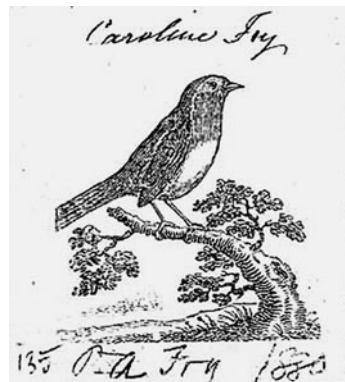
図1 Darton and Harvey 版口絵

挿絵を見ると、口絵及び表題紙のものを含めて12点が用いられている。そのうち、鳥の視点で描かれたものが6点、人の視点で描かれたものが6点（うち鳥の姿を認められるものが3点）である。口絵に大きくこまどりを描き〔図1〕、タイトルと共にこまどりの物