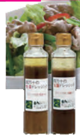
四万十の ドレッシング