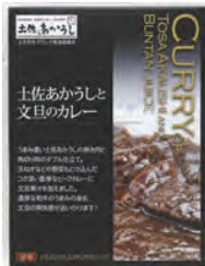
土佐あかうしと文旦のカレー