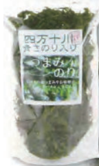
四万十川青さのり入り つまみのり